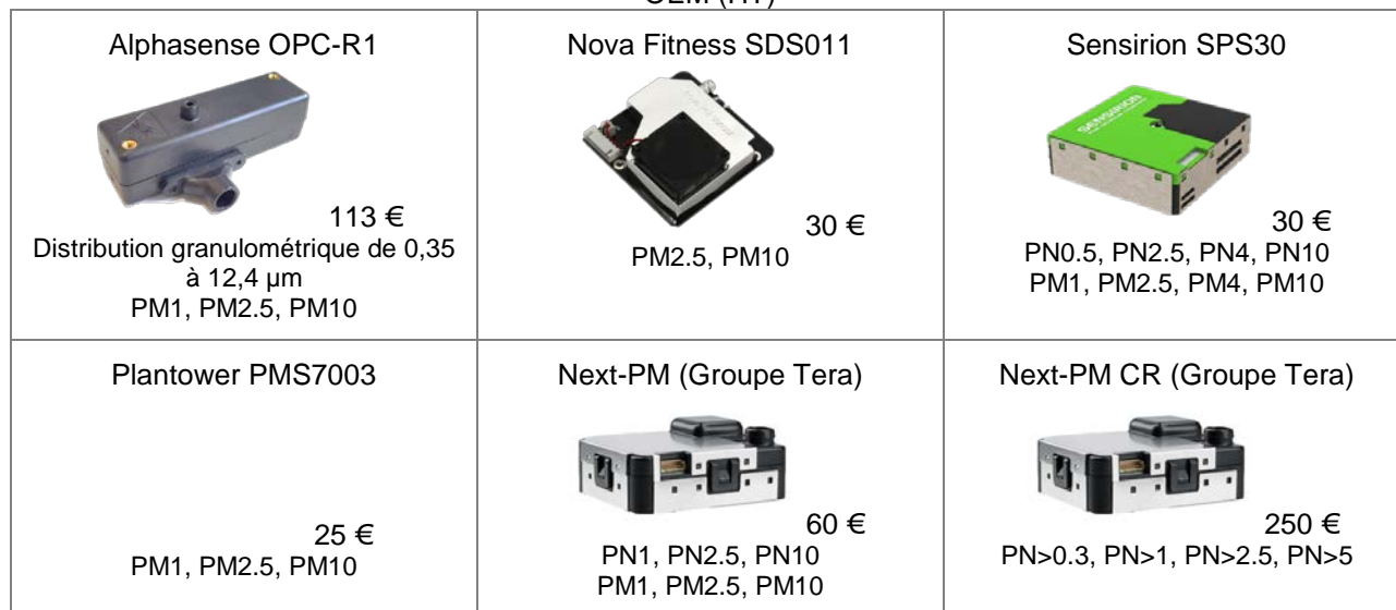
Tableau 1: Micro-capteurs retenus pour les essais en laboratoire , données mesurées et coût en version OEM (HT)

Sur la base de la revue de littérature et de l'étude de marché réalisées, six capteurs en version OEM (capteur seul sans connectique, en anglais Original Equipment Manufacturer ) ont été sélectionnés pour effectuer l'étude expérimentale prévue dans les tâches n°3 et 4 (Tableau 1). Les données mesurées par ces capteurs sont variables d'un dispositif à l'autre mais essentiellement focalisées sur les fractions particulières environnementales (PMx). Aucun de ces capteurs ne renvoie de fraction particulière liée à la santé au travail (fractions inhalable, thoracique et alvéolaire, définies par la norme EN 481).